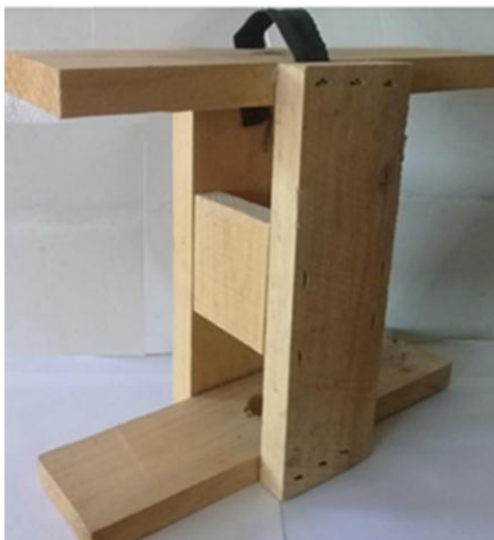
Carrete de madera

CARRETES DE MADERA. Se trabaja con volúmenes altos de producción. Madera de primera con tratamiento térmico.