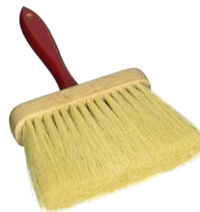
Cepillo utilitario mango rojo