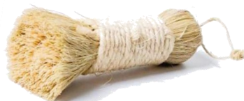
Escobetilla de ixtle