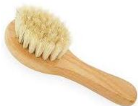
Cepillo tipo paleta