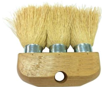
Cepillo 3 mechones