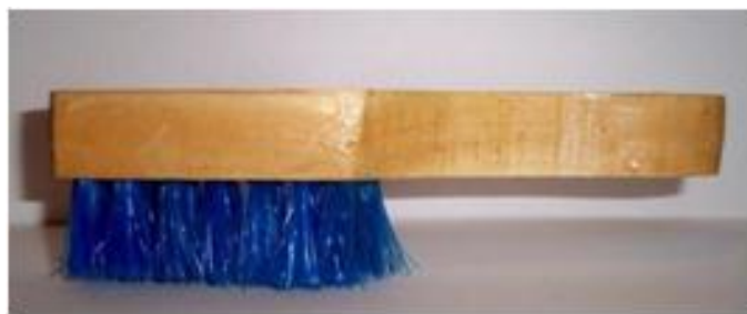
Bolero gamuza c/mango