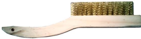
Cepillo cola de pato