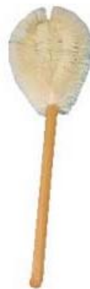
Mano de león (ixtle)