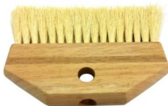
Cepillo ixtle base de madera